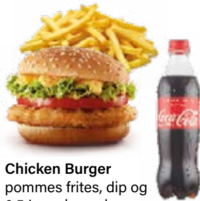
Chicken Burger pommes frites, dip og 0,5 L. sodavand