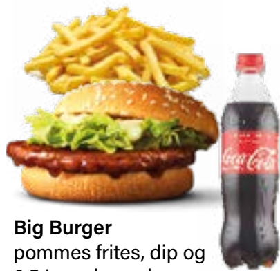
Big Burger pommes frites, dip og 0,5 L. sodavand