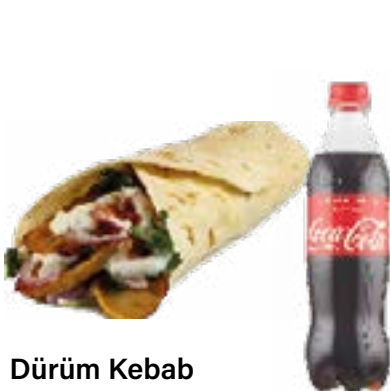
Dürüm Kebab 0,5 L. sodavand

FROKOST TILBUD Fra kl. 11 - 15 Gælder ikke udbringning