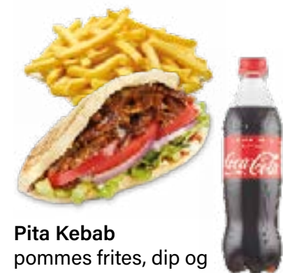
Pita Kebab pommes frites, dip og 0,5 L. sodavand